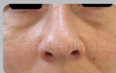
После 2-й процедуры