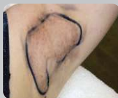
После 3-й процедуры

Омоложение кожи лица и шеи: две процедуры CO 2 + две процедуры RF + три процедуры биоревитализации