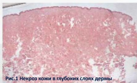
Рис.1 Некроз кожи в глубоких слоях дермы

В аппарате SECRET RF используется биполярная RF частота 2МГц и минимально инвазивные микроиглы для омоложения, объемной подтяжки тканей и улучшения качества кожи. Размещенные с высокой точностью микроиглы в картридже излучают строго контролируруемую радиочастотную энергию на определенную глубину для равномерной термокоагуляции. Настраиваемая интенсивность и глубина проникновения микроигл (в диапазоне от 0,5 до 3,5 мм) обеспечивают выраженный результат при минимальном повреждении эпидермиса. Радиочастотное воздействие способствует нагреву и денатурированию тканей, стимуляции фибробластов, как в субдермальных, так и в дермальных слоях кожи, что приводит к ремоделированию кожи. Фракционный RF лифтинг с микроиглами подходит для всех типов и фототипов кожи (в том числе, и для загорелой кожи).