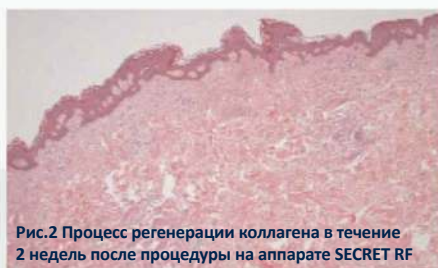
Рис.2 Процесс регенерации коллагена в течение 2 недель после процедуры на аппарате SECRET RF